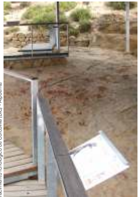
Yacimiento icnológico de Corcolilla (BIC) - Alpuente