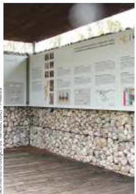
Yacimiento icnológico de Tambuc (BIC) - Millares