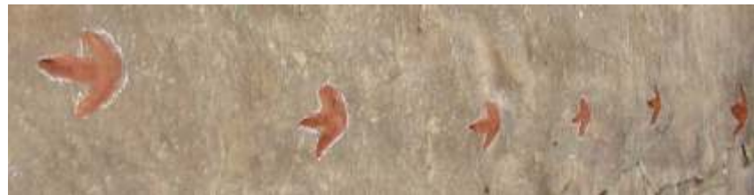
Rastro de huellas de dinosaurios terópodos - Alpuente

camins de dinosaurios : Una propuesta para recorrer la Comunitat Valenciana conociendo su amplio y variado patrimonio paleontológico. Treinta recursos dedicados a la paleontología se reparten por todo el territorio valenciano. Ven a disfrutar de yacimientos, museos y colecciones museográficas que os ayudarán a descubrir y disfrutar del apasionante mundo de los dinosaurios.