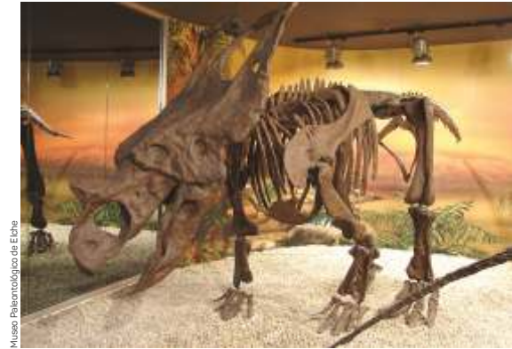
Museo Paleontológico de Elche

camins de dinosaurios : Una propuesta para recorrer la Comunitat Valenciana conociendo su amplio y variado patrimonio paleontológico. Treinta recursos dedicados a la paleontología se reparten por todo el territorio valenciano. Ven a disfrutar de yacimientos, museos y colecciones museográficas que os ayudarán a descubrir y disfrutar del apasionante mundo de los dinosaurios.