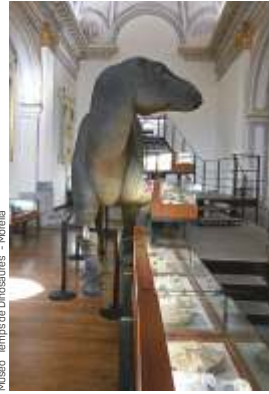
Museo "Temps de Dinosaurius" - Morella