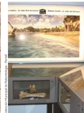
Colección Municipal de Paleontología - Portell