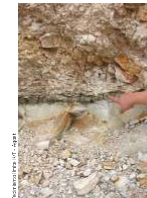
Yacimiento límite K/T - Agost