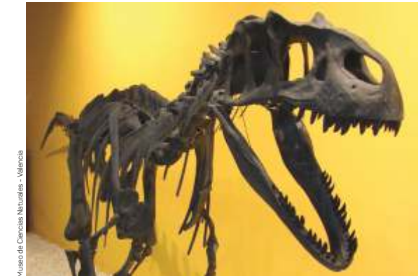
Museo de Ciencias Naturales - Valencia

Acércate a descubrir a los antepasados de los dinosaurios y sus huellas en Bejís, con el yacimiento del Triásico medio más importante de la Comunitat Valenciana. Descubre a los grandes saurópodos del final del Jurásico en el museo de Alpuente y las huellas de los dinosaurios carnívoros que convivieron con ellos en el yacimiento BIC de Corcolilla. En el museo de Morella, conoce al Morelladon el primer dinosaurio de Castellón. En Cincorres podrás visitar el único yacimiento con réplicas de huesos de dinosaurios de la Comunitat Valenciana y conocer los dinosaurios de Els Ports en su museo. En el MUPE de Elche podrás aprender sobre otros dinosaurios de otras partes del mundo. En Millares podrás caminar junto a las huellas de los últimos dinosaurios que pisaron la Comunitat Valenciana. Finalmente en Agost se encuentran las evidencias del impacto que facilitó la extinción de la mayoría de los dinosaurios.