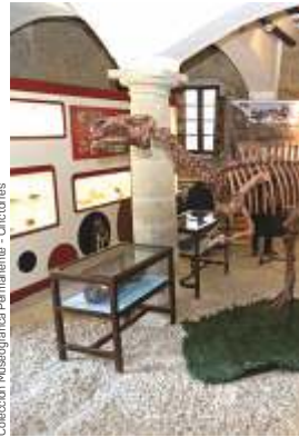
Colección Museográfica Permanente - Cincorres